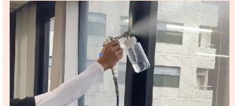
▲エコキメラ専用噴霧器で車内を抗菌コートします