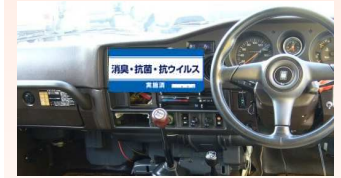
▲実施後シール貼付イメージ